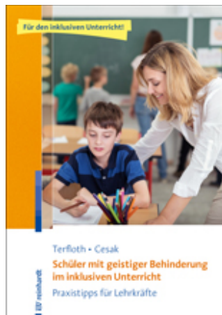
Terfloth, Karin / Cesak, Henrike Schüler mit geistiger Behinderung im inklusiven Unterricht (2016)