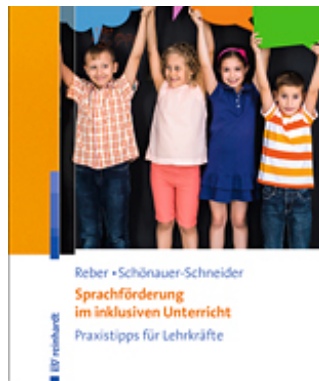
Reber, Karin / Schönauer-Schneider, Wilma Sprachförderung im inklusiven Unterricht (2017)