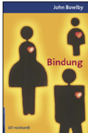
Bowlby, John Bindung (2006)