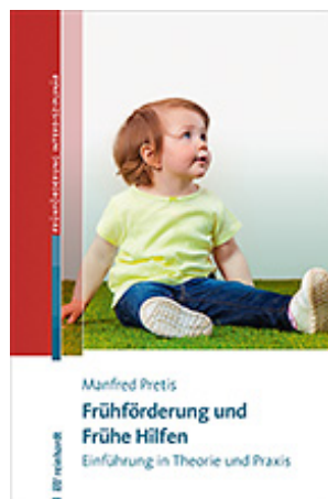
Pretis, Manfred Frühförderung und Frühe Hilfen (2020)