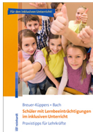
Breuer-Küppers, Petra / Bach, Rüdiger Schüler mit Lernbeeinträchtigungen im inklusiven Unterricht (2016)