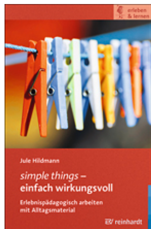
Hildmann, Jule simple things - einfach wirkungsvoll (2017)