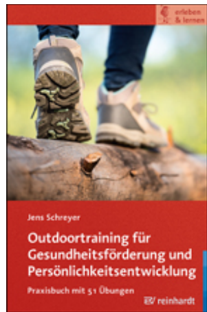
Schreyer, Jens Outdoortraining für Gesundheitsförderung und Persönlichkeitsentwicklung (2017)