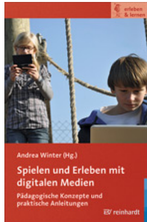
Winter, Andrea (Hrsg.) Spielen und Erleben mit digitalen Medien (2011)