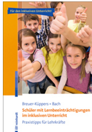
Breuer-Küppers, Petra / Bach, Rüdiger Schüler mit Lernbeeinträchtigungen im inklusiven Unterricht (2016)