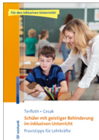
Terloth, Karin / Cesak, Henrike Schüler mit geistiger Behinderung im inklusiven Unterricht (2016)