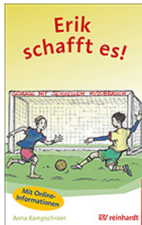
Kampschroer, Anna Erik schafft es! (2020)