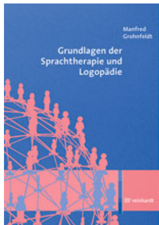
Grohnfeldt, Manfred Grundlagen der Sprachtherapie und Logopädie (2012)