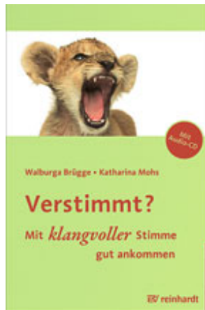
Brügge, Walburga / Mohs, Katharina Verstimmt? (PDF-E-Book) (2011)