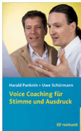
Panknin, Harald / Schürmann, Uwe Voice Coaching für Stimme und Ausdruck (2008)