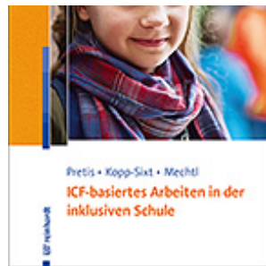
Pretis, Manfred / Kopp-Sixt, Silvia / Mechtl, Rita ICF-basiertes Arbeiten in der inklusiven Schule (2019)