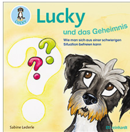
Lederle, Sabine Lucky und das Geheimnis (2020)