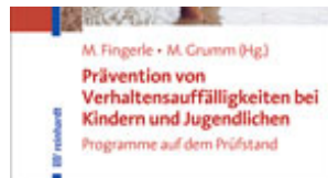
Fingerle, Michael / Grumm, Mandy (Hrsg.) Prävention von Verhaltensauffälligkeiten bei Kindern und Jugendlichen (2012)