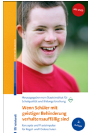
Staatsinstitut für Schulqualität und Bildungsforschung, (ISB) (Hrsg.) Wenn Schüler mit geistiger Behinderung verhaltensauffällig sind (2017)