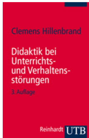
Hillenbrand, Clemens Didaktik bei Unterrichts- und Verhaltensstörungen (2011)