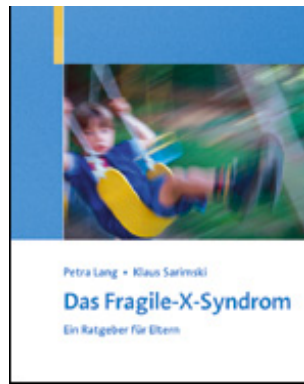
Lang, Petra / Sarimski, Klaus Das Fragile-X-Syndrom (2003)