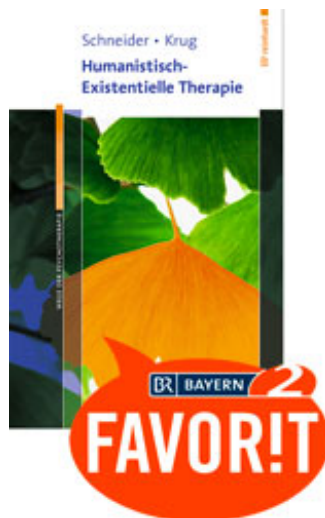
Schneider, Kirk J. / Krug, Orah T. Humanistisch-Existenzielle Therapie (2012)