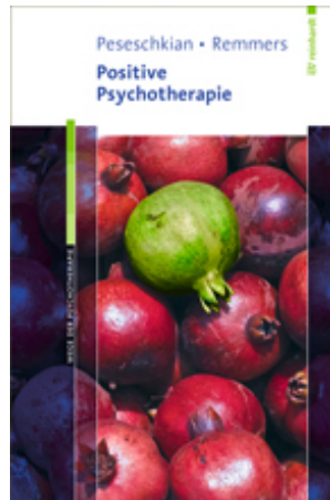
Peseschkian, Hamid / Remmers, Arno Positive Psychotherapie (2013)