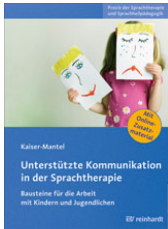
Kaiser-Mantel, Hildegard Unterstützte Kommunikation in der Sprachtherapie (2012)