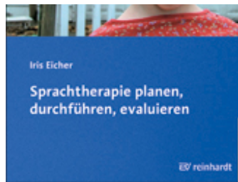
Eicher, Iris Sprachtherapie planen, durchführen, evaluieren (2009)