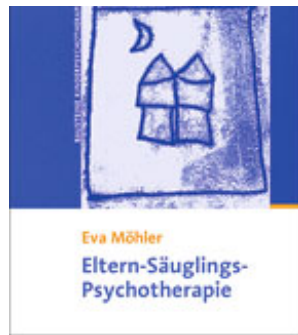
Möhler, Eva Eltern-Säuglings-Psychotherapie (2013)