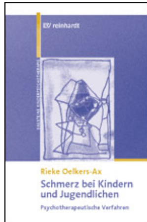
Oelkers-Ax, Rieke Schmerz bei Kindern und Jugendlichen (2006)