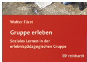
Fürst, Walter Gruppe erleben (2009)