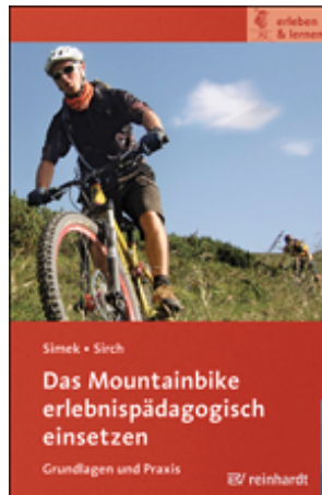
Simek, Jochen / Sirch, Simon Das Mountainbike erlebnispädagogisch einsetzen (2014)