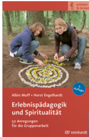
Muff, Albin / Engelhardt, Horst Erlebnispädagogik und Spiritualität (2013)