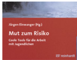
Einwanger, Jürgen (Hrsg.) Mut zum Risiko (2007)