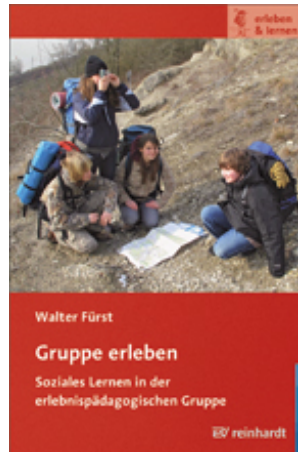
Fürst, Walter Gruppe erleben (2009)