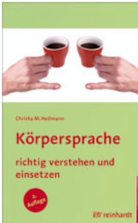
Heilmann, Christa M. Körpersprache richtig verstehen und einsetzen (2011)